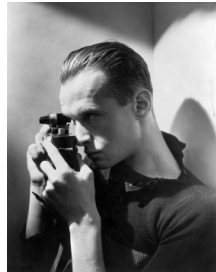
El prestigiós fotògraf llibertari Henri Cartier-Bresson (1908-2004)